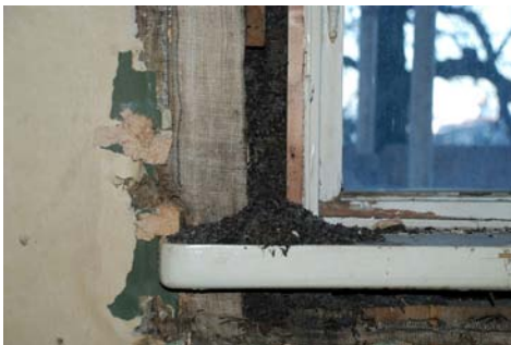
Saxegården, Oslo. Tv. Dekoreret loftsbjælke. Th. Det er ikke blot mennesker, der efterlader sig spor i den bygningskulturelle arv.