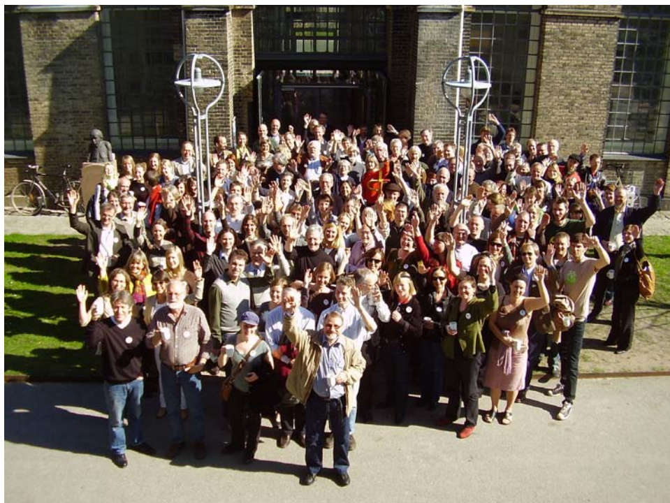
Konferencedeltagerne siger tak for den økonomiske støtte og for tre udbytterige dage i København.

Hva vi kanskje ikke er umiddelbart enige om er